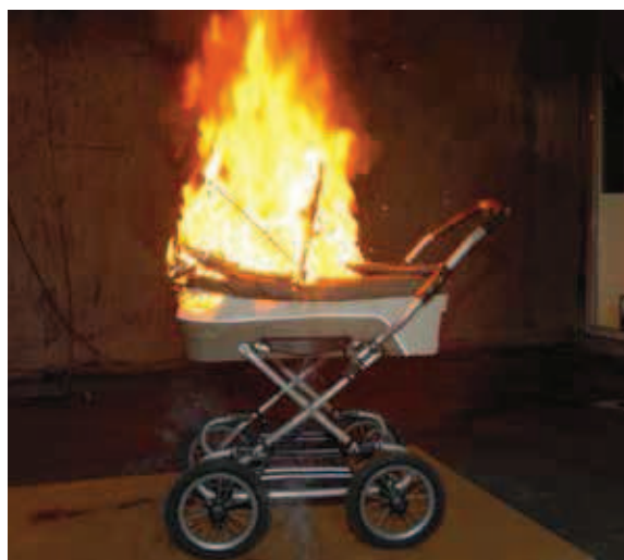
Håll trapphuset fritt från brännbart material och sådant som är i vägen vid en utrymning.

uthyrningen är det lämpligt att den som hyr ut lokalen för en dialog med hyresgästen om hur brandskyddet är tänkt att fungera när det gäller utrymningsvägar, tillåtet antal personer, eventuella larm med mera. I vissa fall kan det också vara lämpligt att tillsammans gå igenom lokalen/lokaler innan de tas i bruk för arrangemanget. Det bör också finnas någon form av skriftlig brandskyddsinformation och checklista till hyresgästen. Sådana bör också vara uppsatta i lokalen.