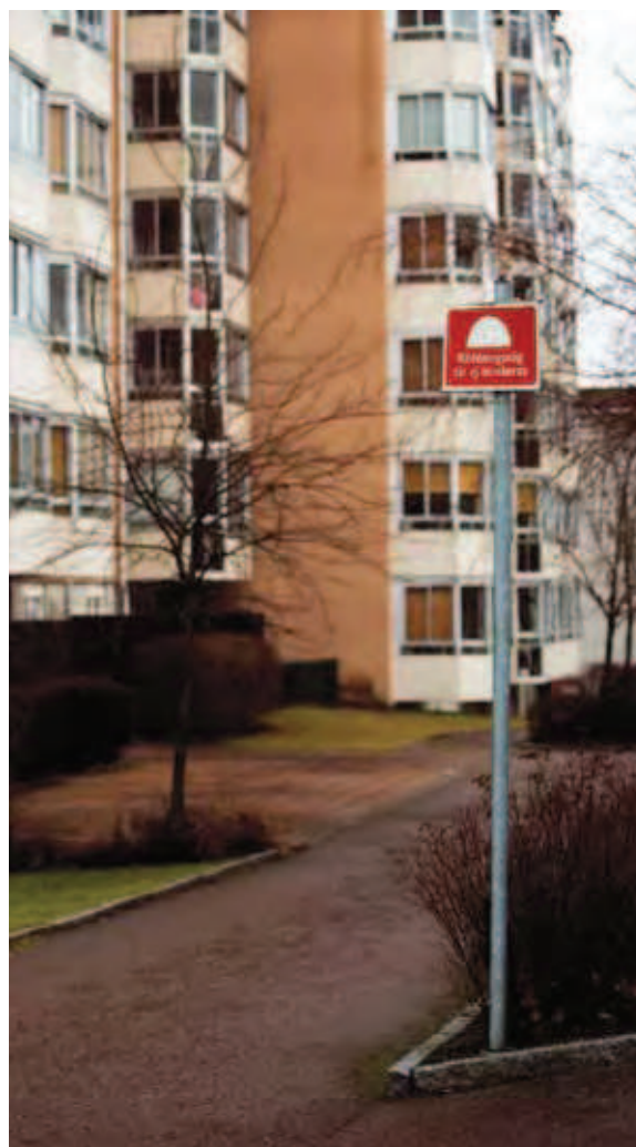
Räddningsvägar ska hållas snöröjda och fria från andra hinder.

Garage förses lämpligast med pulver-släckare eftersom pulver är effektivt mot motorbränder. En sådan fungerar på de flesta typer av bränder och kan användas även för övriga utrymmen. Handbrandsläckare riskerar att bli stulna. Vill man ha släckutrustning i allmänna utrymmen kan vattenslang på rulle i ett fast skåp vara ett bra alternativ.