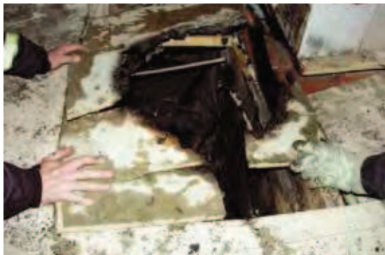
Felaktigt hanterad aska är en vanlig brandorsak. Här har golvet brunnit när aska från en kakelugn som det eldats i dagen före ställts i en plastpåse på golvet.

Bränder i bostäder är ofta eldstadsrelaterade. Därför är det viktigt att uppmärksamma säkerheten kring eldstäder. De boende behöver informeras om vad som gäller för de lokala eldstäder som finns i fastigheten, exempelvis kakelugnar och öppna spisar. Viktig information är om det får eldas i dessa, vad som i så fall får eldas, i vilken omfattning det får eldas och hur askan ska hanteras.