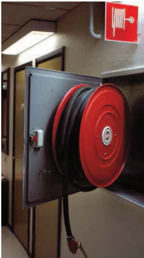
En vattenslang i styv plast är lätt att hantera och finns alltid på plats.