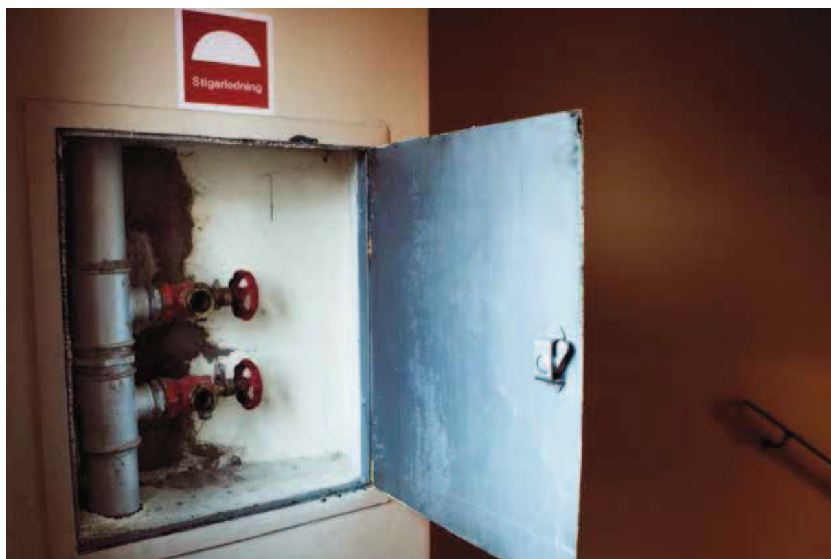
Via stigarledningen i trapphuset får räddningstjänsten vattenförsörjning utan att behöva dra slangar hela vägen från bottenvåningen.