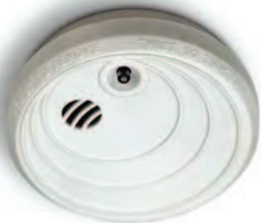
Det ska finnas minst en uppsatt och fungerande brandvarnare i varje lägenhet. Billigare liv- och egendomsförsäkring är svårt att hitta.

brandvarnare installeras, men att de boende sedan själva ansvarar för att regelbundet prova att den fungerar och byta batterier vid behov.