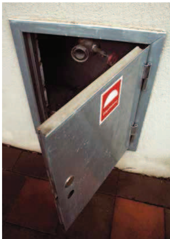
I stigarledningen i luckan på fasaden kan räddningstjänsten koppla in vatten. Inne i trapphuset finns sedan uttag där slangar kan anslutas.

I trapphus utgörs brandventilationen ibland av vanliga öppningsbara fönster. Det är viktigt att se till att lekande barn inte kan falla genom dessa. För att hindra olyckor kan exempelvis ett utvändigt galler användas.